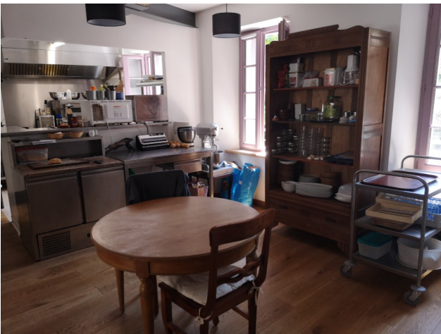
Local de préparations : 18 m 2