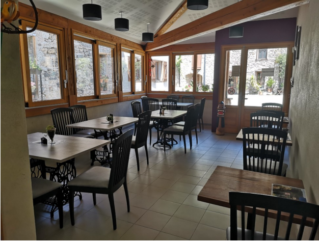
salle de restaurant 26 places (32 m 2 )