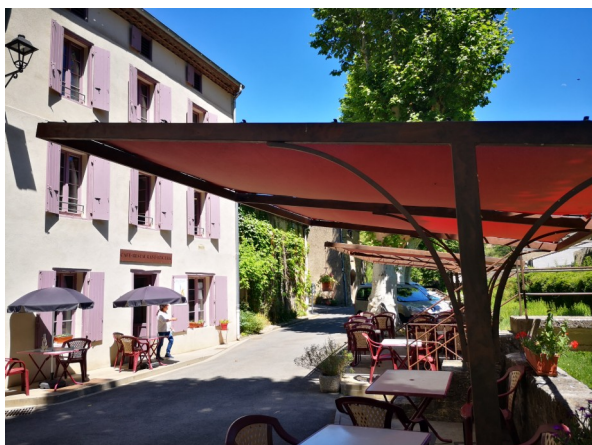
Terrasse couverte le long du ruisseau