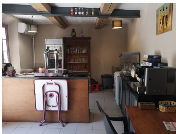
bar et espace produits du terroir (28 m 2 environ)