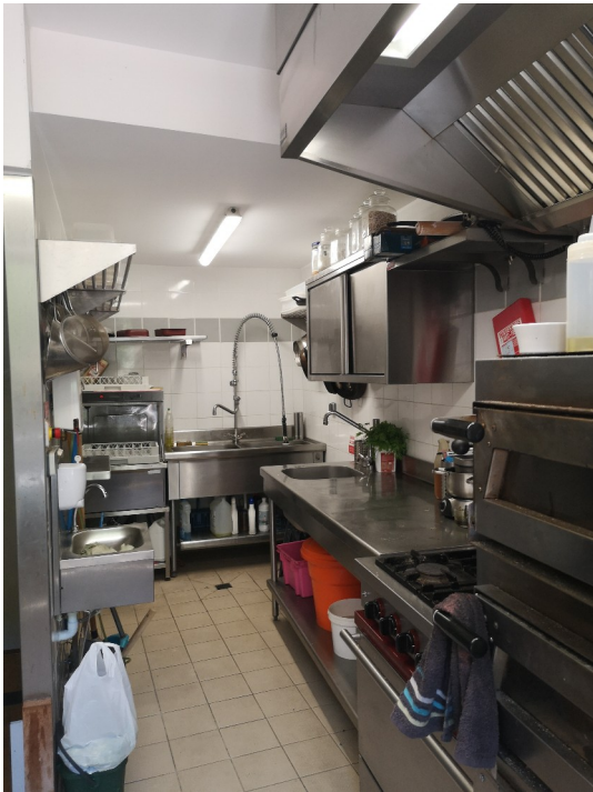
Cuisine : 12 m 2