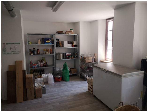
Local de stockage